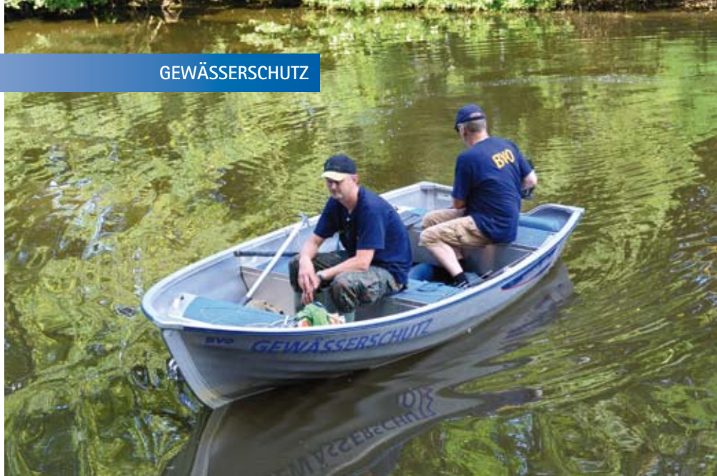
Mit drei Fischereiaufsichtsbooten überwachen rund 40 Fischereiaufseher und Gewässerwarte die Verbandsgewässer.

In allen Fällen folgte eine strafrechtliche Würdigung mit entsprechenden