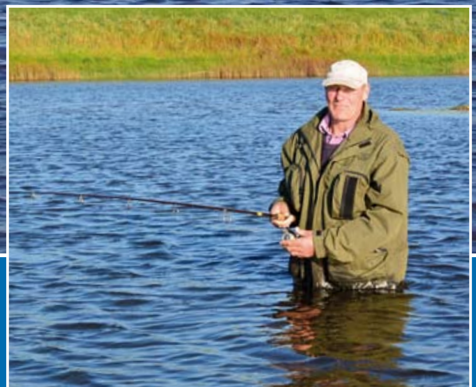
Beliebt: Watangeln im Leybucht-Verbindungs-Kanal